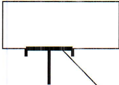
Схема границ раздела

Граница раздела по Договору № 642 (по всем пунктам)